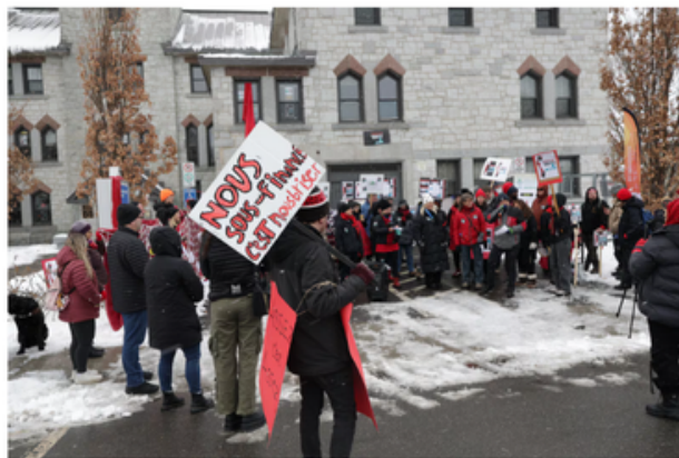
Plusieurs personnes de différents organismes communautaires se sont réunies lundi matin au centre Richard-Goulet.